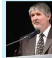
Giuliano Poletti Presidente Legacoop Nazionale