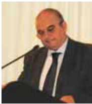
Giorgio Pugliese Ministero dello Sviluppo Economico, Direzione Generale politiche dei fondi strutturali comunitari

tori delle politiche di sviluppo sui problemi legati al migliore utilizzo delle risorse della programmazione comunitaria 2007-2013.