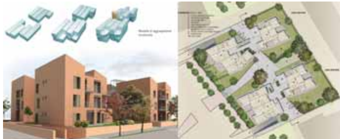
1° Classificato FOLIGNO: Case accorte 812