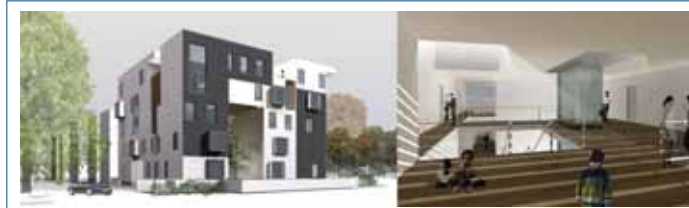
1° Classificato PESARO: Regatta de blanc 980

Il contributo richiesto riguardava pertanto la progettazione di massima degli edifici e degli impianti. La scheda dell'area individuava il numero di alloggi, gli obiettivi specifici, la spesa massima dell'intervento. Il giudizio della giuria sulla qualità del progetto era in sostanza subordinato alla rispondenza dello stesso ai requisiti minimi previsti dal concorso, e cioè dalla realizzabilità delle soluzioni progettuali, alla fattibilità riferita alla