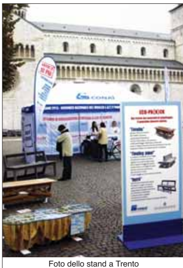
Foto dello stand a Trento

Oggi, i risultati nazionali di recupero complessivo dei rifiuti di imballaggio di acciaio, alluminio, carta, legno, plastica e vetro raggiungono il 73,9% , equivalente a 8.024.000 tonnellate recuperate su 10.863.000 tonnellate immesse al consumo. Il sistema ha registrato una crescita del recupero complessivo di +5,25 punti percentuali rispetto all'anno precedente (da 68,6% a 73,9%) e, contestualmente, una riduzione delle quantità di rifiuti di imballaggio destinate a discarica, che nel 2009 sono scese al 26% del totale dei rifiuti da imballaggio.