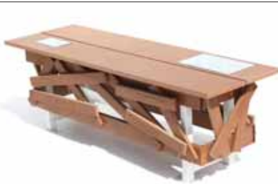
Una delle 120 panchine "Favelas" realizzate da CONAI con materiali riciclati e donate ai 20 Comuni che hanno partecipato alla 1° Giornata nazionale del Riciclo

lità alla 1° il corrispettivo è quattro volte tanto: si passa da 2,3 milioni di euro a 9,5 milioni di euro all'anno. Risorse preziose che i Comuni utilizzeranno per il progressivo miglioramento del servizio di gestione dei rifiuti da imballaggio per i cittadini.