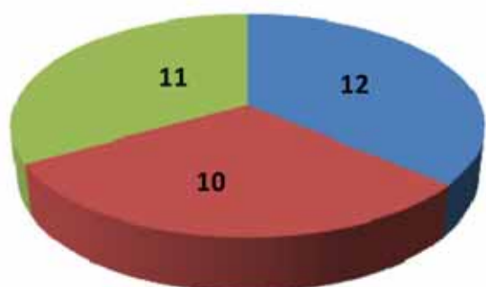
Composizione campione per comparto (numero cooperative)

■ Filiera costruzioni ■ Consumer ■ Metalmeccanica/beni durevoli e strumentali