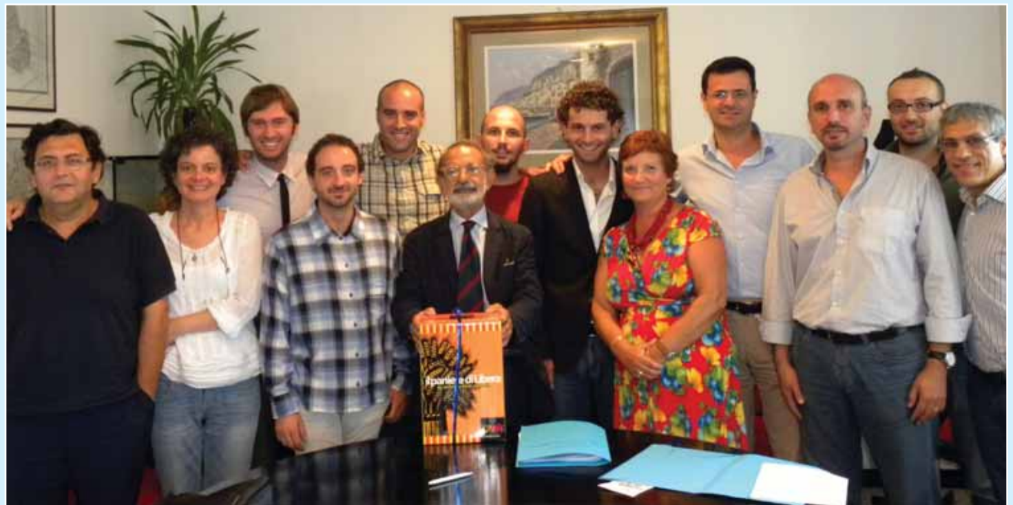
Costituzione della cooperativa 'Le terre di Don Pepe Diana'

Encodata S.p.A. Via Fermi, 44 - 20090 Assago Tel. 02.4880202 Fax 02.4883445 www.encodata.it century@encodata.it