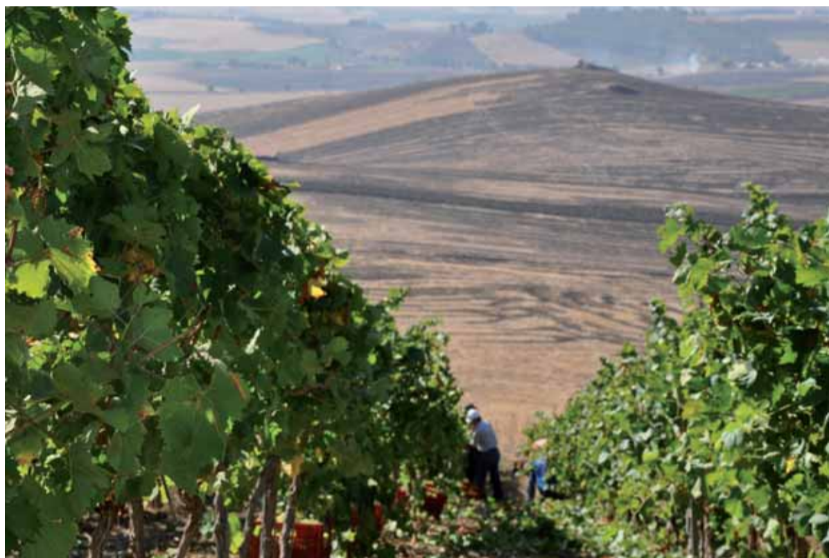
Nella foto le vigne della cooperativa Placido Rizzotto sostenuta da Coopfond